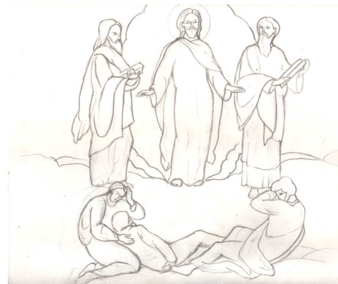
Grafică realizată de Elena Gheorghiu

Marți, 6 august: Schimbarea la Față a Domnului