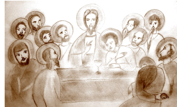
Cina cea de Taină—Grafică realizată de Ștefana Voicu

Cu gânduri vesele să lăudăm pe Sfinții Strămoși ai Mântuitorului, cei însuflețiți de nădejdea vederii Celui Nevăzut. Veniți să cinstim pe Avraam și pe toți cei ce au răsărit din el. Cu David să împletim cântări de psalmi și cu blândețea lui Moise să ne apropiem de rugăciunii, aducând jertfa noastră de gânduri bune mai înainte de praznicul nașterii Domnului. Pe Acesta să-L rugăm, plecând înaintea lui gând umilit: Cu rugăciunile celor pe care mai dinainte i-ai ales să străbată calea vieții mai înainte de arătarea Ta în Trup pe pământ, ajută-ne pe noi a urma cu osârdie calea mântuirii !