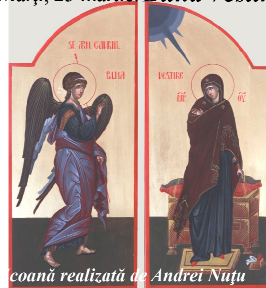
icoană realizată de Andrei Nuțu

Astăzi, Duminică, 23 martie 2014, între orele 13:00-15:00, la Iași are loc a patra ediție a „Marșului pentru viață”, acțiune ce a cuprins toate orașele României. Tema din acest an este „Adopția, o alegere nobilă”. Evenimentul e organizat de Arhiepiscopia Iașilor, prin Sectorul de misiune, statistică și prognoză pastorală, Departamentul Pro Vita, împreună cu Asociația Studenți pentru Viață din București.