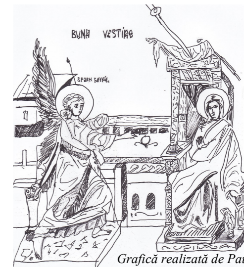
Grafică realizată de Paula Neagu