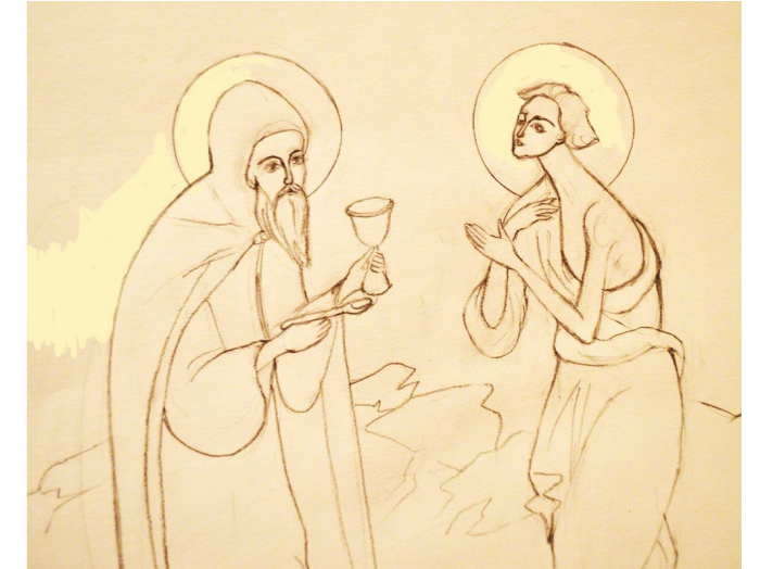
Grafică realizată de Elena Gheorghiu

(Stihiră din Paraclisul Sfintei Cuvioase Maria Egipteanca)