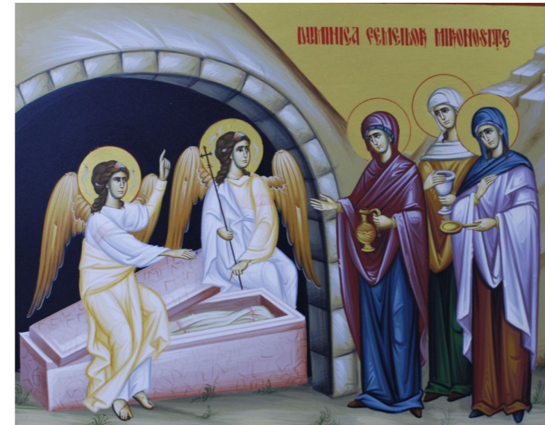
Ilustrație realizată de Cristian Ștefan