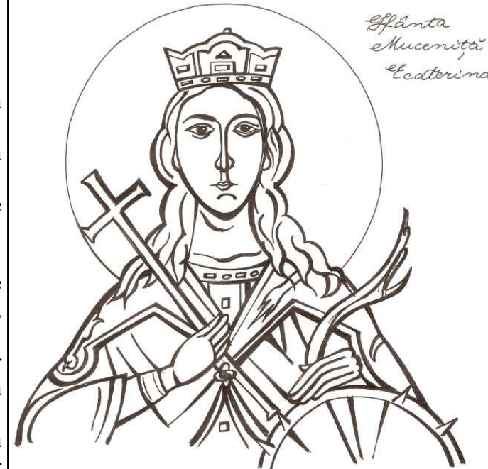
Grafică realizată de Raluca Negrea

( Ilustrație realizată de Ștefana Voicu )