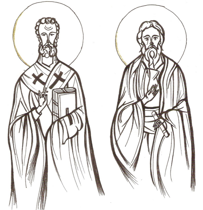
Grafică realizată de Raluca Negrea