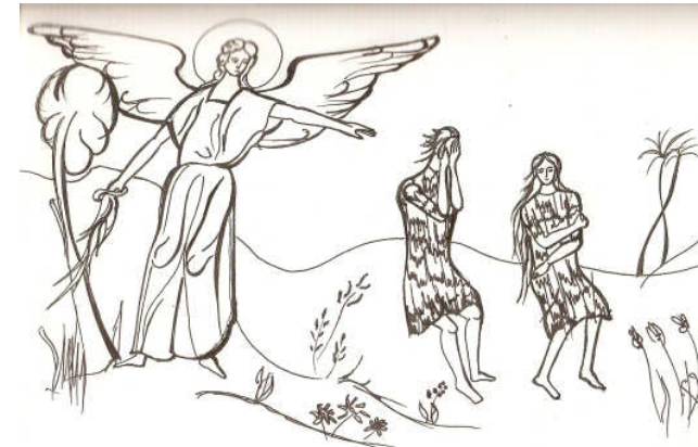
Grafică realizată de Raluca Negrea