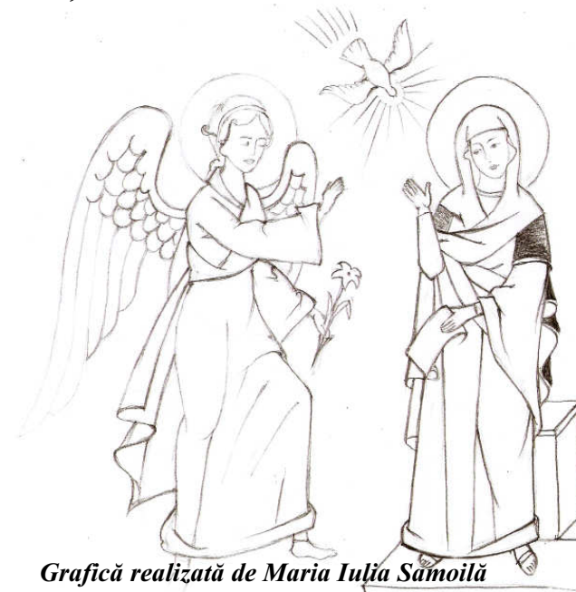
Grafică realizată de Maria Iulia Sămoilă