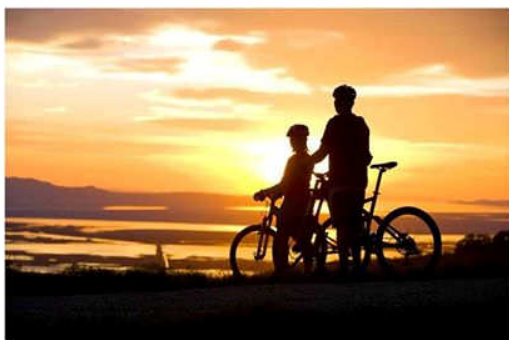
Grupul cicliștilor pelerini ai Parohiei Toma Cozma