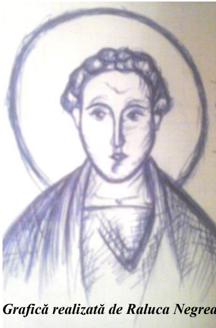
Grafică realizată de Raluca Negrea

În ziua cea dintâi a săptămânii, când s-a înserat și ușile fiind încuiate, acolo unde erau ucenicii adunați de frica iudeilor, a venit Iisus, a