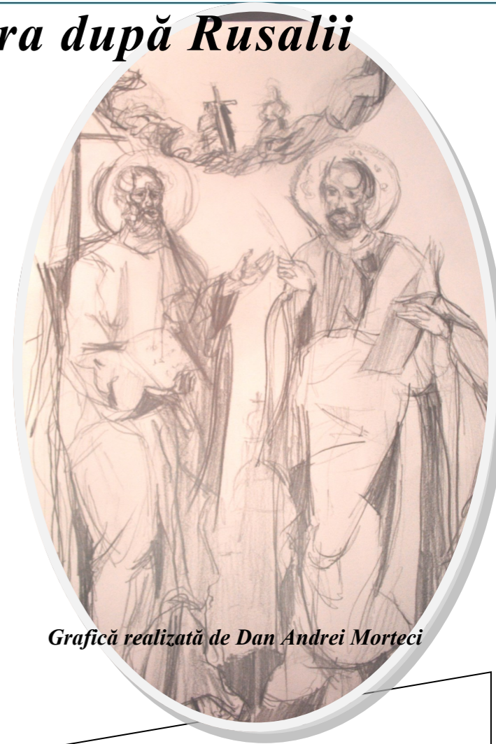
Grafică realizată de Dan Andrei Morteci

În vremea aceea, când a intrat Iisus în Capernaum, iată că s-a apropiat de Dânsul un sutaș, rugându-L și grăind: Doamne, servitorul meu zace în casă bolnav, cumplit chinându-se. Iisus i-a zis: voi veni și-l voi tămădui. Dar sutașul, răspunzând, a zis: Doamne, eu nu sunt vrednic să intri sub acoperișul meu, ci zi numai cu cuvântul și se va tămădui servitorul meu; căci și eu sunt om sub stăpânirea altora și am sub mine ostași și-i zic acestuia: du-te, și se duce; și celuiilalt: vino, și vine; și servitorul meu zic: fă aceasta, și face. Auzind acestea, Iisus S-a minunat și a zis celor care veneau după Dânsul: adevărat vă spun vouă: nici în Israel n-am găsit atâta credință. Drept aceea vă spun că mulți de la răsărit și de la apus vor veni și se vor odihni cu Avraam, cu Isaac și cu Iacob, în împărăția cerurilor; iar fiii împărăției vor fi izgoniți în întunericul cel mai din afară, acolo va fi plângerea și scrâșnirea dinților. Și a zis Iisus sutașului: du-te, și, după ce ai crezut, fie ție! Și s-a tămăduit servitorul lui în ceasul acela.