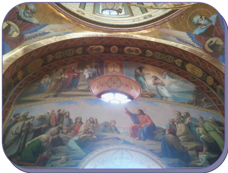
Frescă de la Mănăstirea Curchi, Republica Moldova

*începând cu ora 8.00 se va oficia Slujba Utreniei și a Sfintei Liturghii