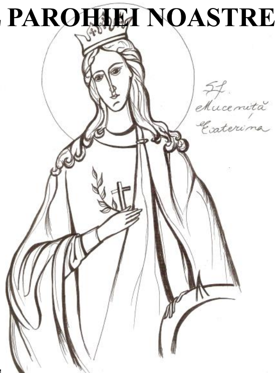
Grafică realizată de Raluca Negrea

Zis-a Domnul Pilda aceasta: unui om bogat i-a rodit țarina și se gândea în sine, zicând: ce voi face, căci nu am unde să-mi strâng roadele mele? Dar și-a zis: aceasta voi face: voi strica hambarele mele și mai mari le voi zidi; și voi strânge acolo toate roadele mele și bunătățile mele. Apoi voi zice sufletului meu: suflete, acum ai multe bunătăți strânse pentru mulți ani; odihnește-te, mănâncă, bea, veselește-te. Însă Dumnezeu i-a zis: nebune, în această noapte vor cere de la tine sufletul tău; iar cele ce ai strâns tu ale cui vor mai fi? Așa se întâmplă cu cel care-și adună comoară pentru sine însuși, și nu în Dumnezeu se îmbogățește.