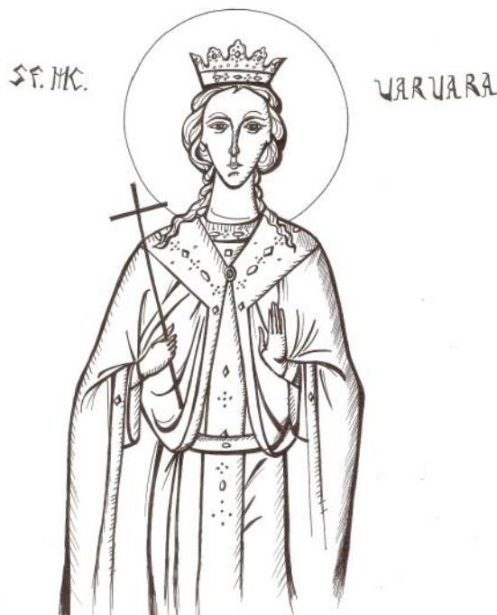
Grafică realizată de Raluca Negrea

*Pentru foloș duhovnicesc, recomandăm primirea Tainei Sfintei Împărtășanii duminică și în sărbători, în timpul Sfintei Liturghii, după momentul Sfintei Jertfe, respectiv, după Împărtășirea preoților.