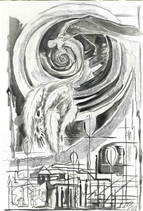
Căderea în sus - grafică realizată de Mădălina Brăteanu

Știm că toate faptele noastre sunt curate și plăcute înaintea lui Dumnezeu dacă sunt săvârșite cu inimă smerită, adică din dragoste pentru aproapele și cu gândul la rai. Căci iubirea este împlinirea legii (Rom. 13, 10). Aici trebuie să vedem ochii ca mijlocul prin care săvârșim totul. Dacă acest mijloc este curat, drept și se îndreaptă către Cel care trebuie să se îndrepte, atunci fără îndoială toate faptele noastre sunt fapte bune, pentru că sunt săvârșite întocmai cu acel mijloc. Și prin tot trupul, Hristos se referă la toate acele fapte pe care El le condamnă și pe care ne cere să le lepădăm. Căci Apostolul numește și anumite fapte, mădulare ale trupului: omorâți mădularele voastre, cele pământești: desfrânarea, necurăția, patima (Col. 3, 5) și altele asemenea.