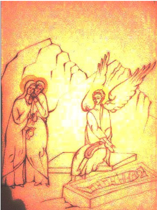
Grafică realizată de Raluca Negrea

Foaie duminicală a parohiei "Toma Cozma"