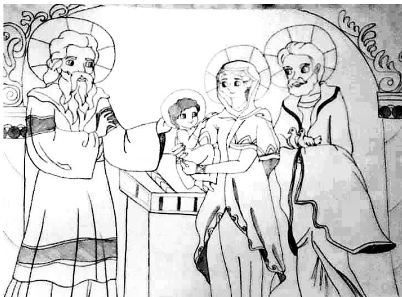
Grafică realizată de Simona Angheluță