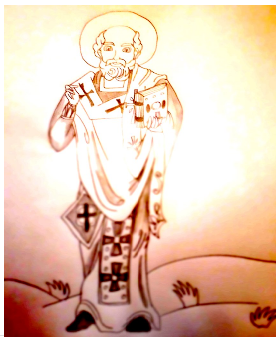
Grafică realizată de Simona Angheluță

Astăzi, 16 februarie: Sf. Ier. Flavian, arhiepiscopul Constantinopolului