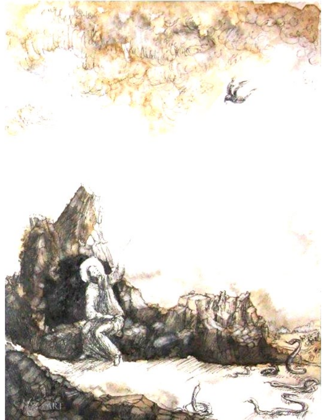
„Izgonirea în pustie. Ispită și credință.” din seria „Pașii profetului”, Tehnică mixtă pe hârtie, realizată de

Vă dorim tuturor o primăvară calendaristică frumoasă și o primăvară a sufletului care începe mâine odată cu Postul cel Mare cu mult folos duhovnicesc!