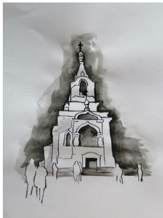
Grafică realizată de Elena Gheorghiu Vornicu

Lavra Poceaev, un bastion vechi al Ortodoxiei, adăpostește de aproximativ 400 de ani icoana făcătoare de minuni a Maicii Domnului.