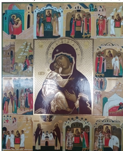
Icoană a Maicii Domnului de la Mănăstirea Schimbarea la Față, Muntele Ceahlău

Văzând naștere minunată, să ne înstră-inăm de lume, mutându-ne min-tea la Cer; că pentru aceasta Prea-înaltul Dumnezeu pe pământ S-a arătat Om smerit, vrând să tragă la înăl-țime pe cei care-I cântă: Aliluia!