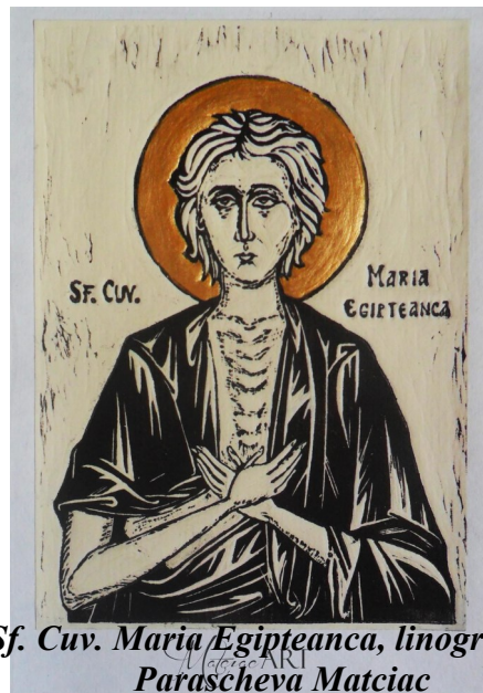
Sf. Cuv. Maria Egipteanca, linogravură, Parascheva Matciac

Cuviosul Ioan Scărarul s-a pogorât de la muntele Sinai la noi ca un nou văzător de Dumnezeu, și ne-a arătat pe ale sale lespezi scrise de Dumnezeu – cuvinte ce se numesc „Scară” –, în care literele cele văzute învață osteneală, iar puterea ce se înțelege povățuiește la vederea de Dumnezeu.