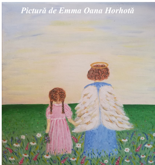
Pictură de Emma Oana Horhotă

Romanița, Rozalia, Rosa, Stejarel, Trandafira, Violeta, Viorică, Viorel, Viorela, Zambila, Zambilica etc.