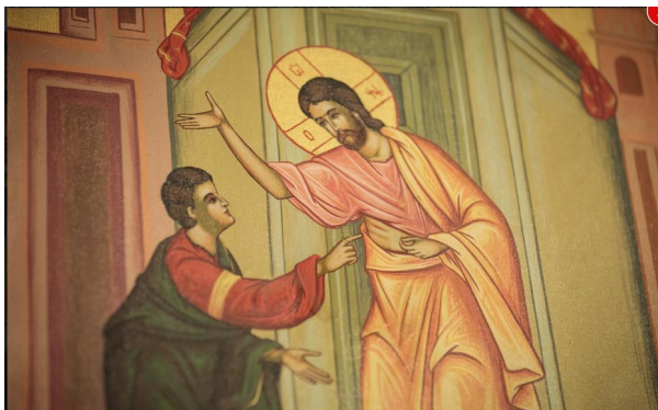
Icoană din biserica noastră

Elementele credinței se aprofundează singular, dar se trăiesc la plural. Nu poți să-ți dovedești credința, fără fapte! spune Sfântul