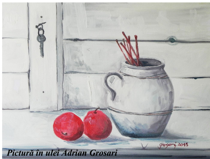
Pictură în ulei Adrian Grosari