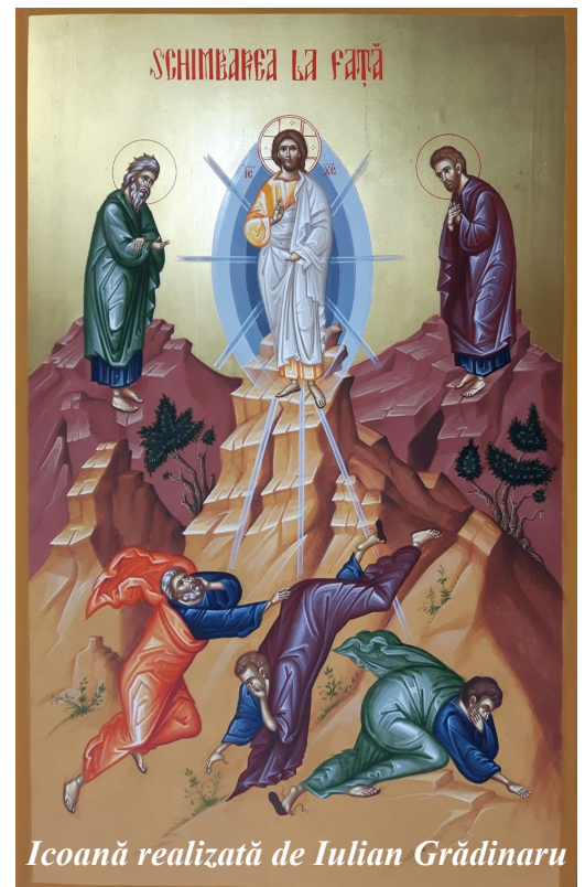
Icoană realizată de Iulian Grădinaru

Și El a zis: Aduceți-Mi-le aici. Și poruncind să se așeze mulțimile pe iarbă și luând cele cinci pâini și cei doi pești, și privind la cer, a binecuvântat și, frângând, a dat ucenicilor pâinile, iar ucenicii, mulțimilor. Și au mâncat toți și s-au săturat și au strâns rămășițele de fărâmituri, douăsprezece coșuri pline. Iar cei ce mâncaseră erau ca la cinci mii de bărbați, afară de femei și de copii. Și îndată Iisus a silit pe ucenici să intre în corabie și să treacă înaintea Lui pe țărnul celălalt, până ce El va da drumul mulțimilor.