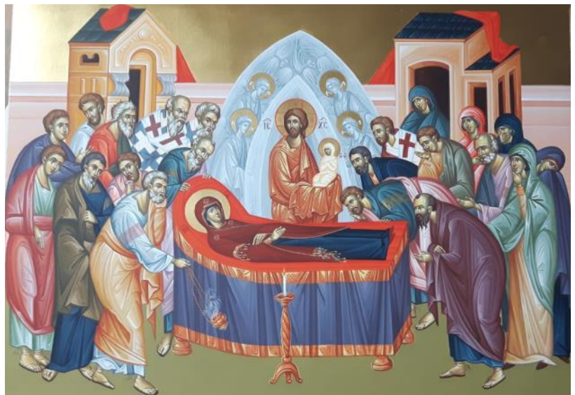
Icoană realizată de Iulian Grădinaru

Vă dorim post ușor și ziditor în continuare!