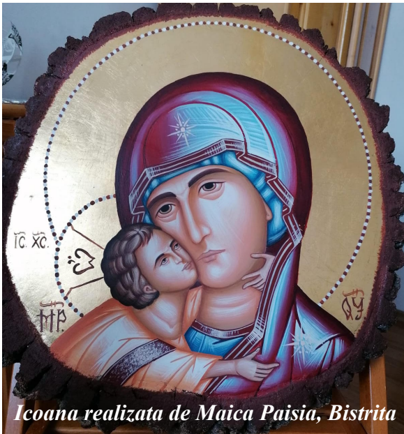
Icoana realizata de Maica Paisia, Bistrita

Astăzi, 27 septembrie: Sf. Ier. Martir Antim Ivireanul, mitropolitul Țării Românești