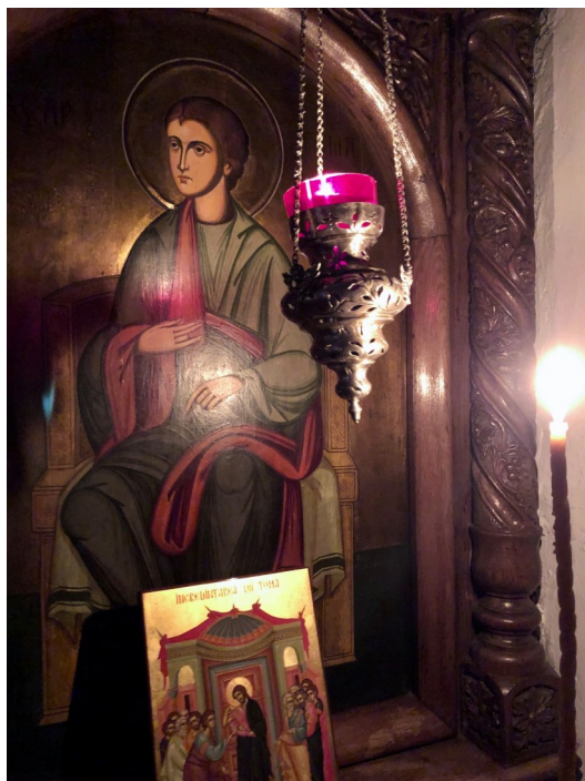
Sf. Apostol Toma, icoană din biserica noastră

Marti, 6 octombrie: Sf. Ap. Toma, ocrotitorul parohiei noastre