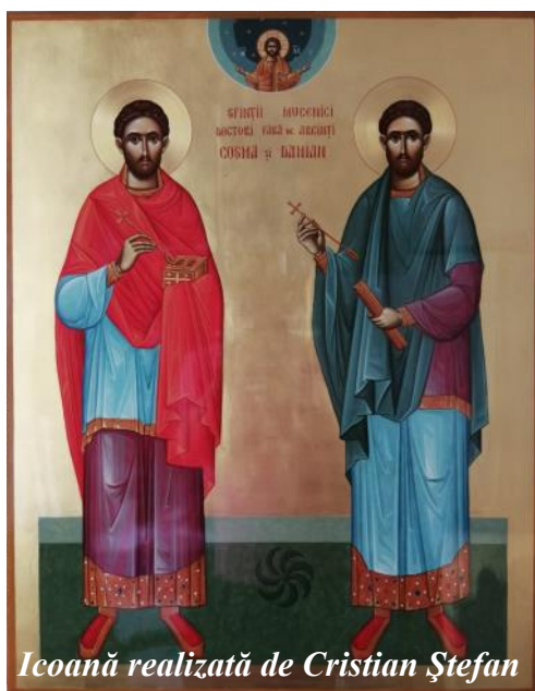
Icoană realizată de Cristian Ștefan

Astăzi, 1 noiembrie: Sf. Doctori fără de arginți Cosma și Damian