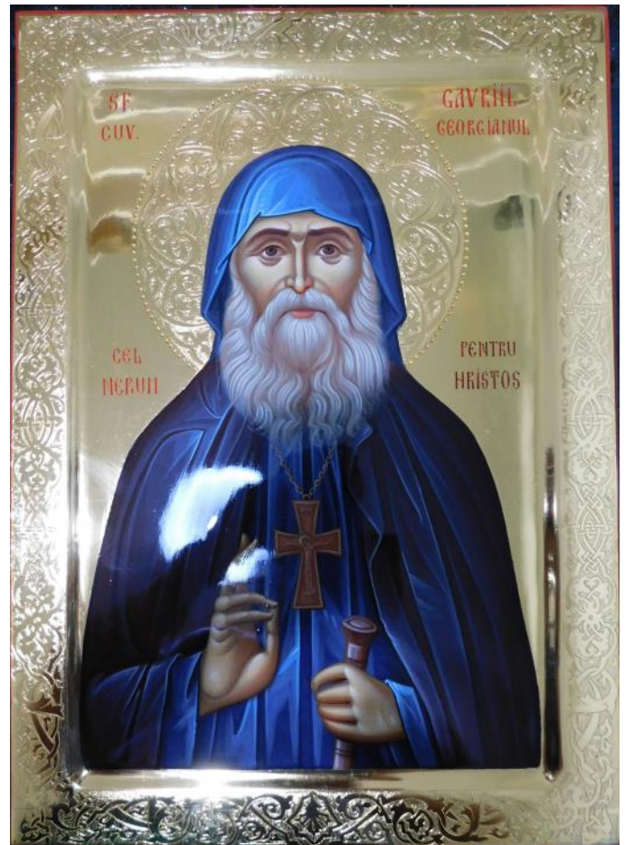
Icoană realizată Miruna Ștefan