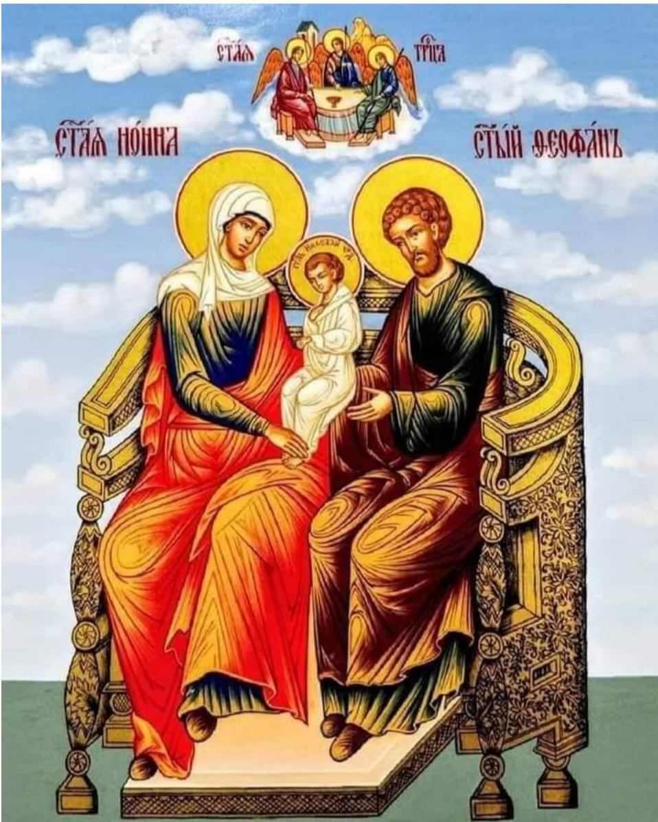
(o icoană rară a Sfântului Nicolae prunc, împreună cu părinții săi, Teofan și Nona).

Ca un preacald ocrotitor al celor din necazuri și al săracilor ajutor și sprijin, al călătorilor îndrumător cinstit, scapă-ne pe noi pe toți de nevoi și primejdii, sănătate dându-ne, bucurie și pace, ca un păstor preabun și milostiv, Sfinte Nicolae, Ierarhe al lui Hristos.