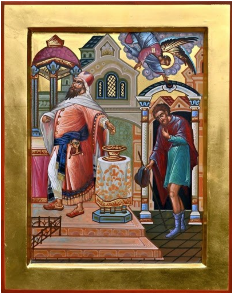
Evangelia Duminicii Vameșului și Fariseului (Luca 18, 10-14)

Zis-a Domnul pilda aceasta: Doi oameni s-au suit la templu ca să se roage: unul era fariseu și celălalt vameș. Fariseul, stând drept, așa se ruga în sine: Dumnezeule, Îți mulțumesc că nu sunt ca ceilalți oameni, răpitori, nedrepti, preadesfrânați, sau ca și acest vameș. Postesc de două ori pe săptămână, dau zeciuală din toate câte câștig. Iar vameșul, departe stând, nu voia nici ochii să-și ridice către cer, ci-și bătea pieptul, zicând: Dumnezeule, milostiv fii mie, păcătosului! Zic vouă că acesta s-a coborât mai îndreptat la casa sa decât acela. Fiindcă oricine se înalță pe sine se va smeri, iar cel ce se smerește pe sine se va înalța.