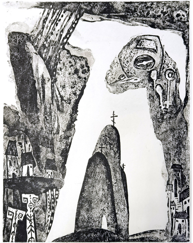
„Limanul cel neînviforat” din tripticul „Taina care ne apără”, cartonogravură și cologravură pe hârtie realizată de Parascheva Matciac

Zis-a Domnul: Era un om bogat care se îmbrăca în porfiră și în vison, veselindu-se în toate zilele în chip strălucit. Iar un sărac, anume Lazăr, zăcea înaintea porții lui, plin de bube, poftind să se sature din cele ce cădeau de la masa bogatului; dar și câinii venind, lungeau bubele lui. Și a murit săracul și a fost dus de către îngeri în sânul lui Avraam. A murit și bogatul și a fost înmormântat. Și, în iad, ridicându-și ochii, fiind în chinuri, el a văzut de departe pe Avraam și pe Lazăr în sânul lui. Și el, strigând, a zis: Părinte Avraame, fie-ți milă de mine și trimite pe Lazăr să-și ude vârful degetului în apă și să-mi răcorească limba, căci mă chinuiesc în această văpaie! Dar Avraam a zis: Fiule, adu-ți aminte că tu ai primit cele bune ale tale în viața ta, iar Lazăr, asemenea, pe cele rele; și acum aici el se mângâie, iar tu te chinuiești. Și, peste toate acestea, între noi și voi s-a întărit prăpastie mare, ca aceia care voiesc să treacă de aici la voi să nu poată, nici cei de acolo să treacă la noi. Iar el a zis: Rogu-te, dar, părinte, să-l trimiți în casa tatălui meu, căci am cinci frați, să le spună lor acestea, ca să nu vină și ei în acest loc de chin. Și i-a zis Avraam: Au pe Moise și pe proroci; să asculte de ei. Iar el a zis: Nu, părinte Avraame, ci, dacă cineva dintre morți se va duce la ei, se vor pocăi. Și i-a zis Avraam: Dacă nu ascultă de Moise și de proroci, nu vor crede nici dacă ar învia cineva din morți.