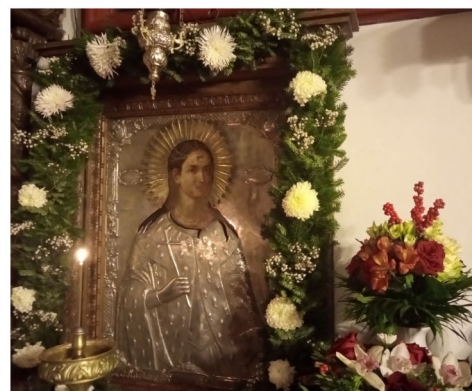
La Biserica noastră se păstrează și moaștele Sf. M. Mc. Ecaterina

După Sfânta Liturghie, se va oficia Slujba Parastasului pentru ctitori, pentru toți cei adormiți și vor fi oferite mici semne ale iubirii creștine tuturor celor prezenți