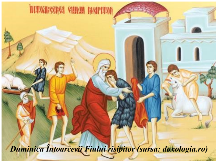
Duminica Întoarcerii Fiului risipitor

Tatăl vine afară și-i spune: Fiule, tu totdeauna ești cu mine (Lc 15, 31). Cum este el împreună cu fiul său? Este împreună cu fiul său în persoana lui Abel, Enoh, Sem, Avraam, Isaac, Iacov, Moise și a tuturor oamenilor sfinți din care se trage seminția evreiască a lui Hristos, citită în Evanghelie, zicând: Avraam a născut pe Isaac, Isaac a născut pe Iacov (Mt. 1, 2) și așa mai departe.