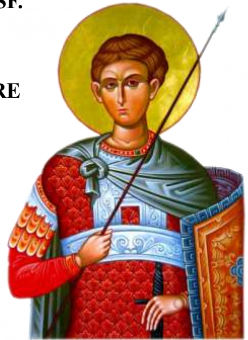
Troparul, glasul al 3-lea

Mare apărător te-a aflat întru primejdii lumea, purtătorule de chinuri, pe tine cel ce ai biruit pe păgâni. Deci precum mândria lui Lie ai surpat și la luptă îndrăzneț ai făcut pe Nestor, așa Sfinte Dimitrie, pe Hristos Dumnezeu roagă-L să ne dăruiască nouă mare milă.