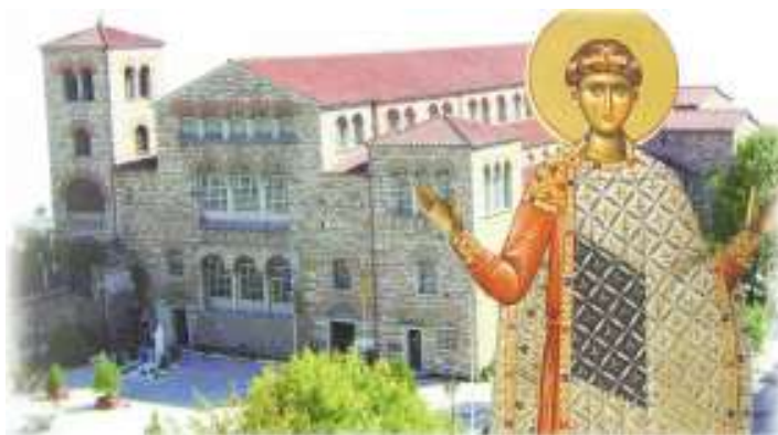
Biserica în care se află moaștele Sfântului Dimitrie Izvorătorul de Mir, Ocrotitorul Salonicului.

Când în anul 1986 pronia lui Dumnezeu m-a adus în Salonic la studii, a fost pentru prima oară când am venit în contact direct cu harul și cu binecuvântarea Sfântului slăvitului Mare Mucenic Dimitrie