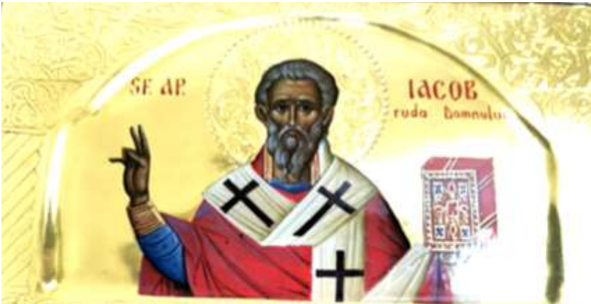
Sfântul Apostol Iacov Ruda Domnului - icoana de la chivotul unde se află moaștele sale, în biserica noastră

Ne vom serba pe Sfântul ocrotitor, astăzi de la ora 18.00, când se va oficia SLUJBA DE PRIVEGHERE ȘI SFÂNTUL MASLU, ÎN SOBOR DE PREOȚI. VĂ AȘTEPTĂM CU DRAG!