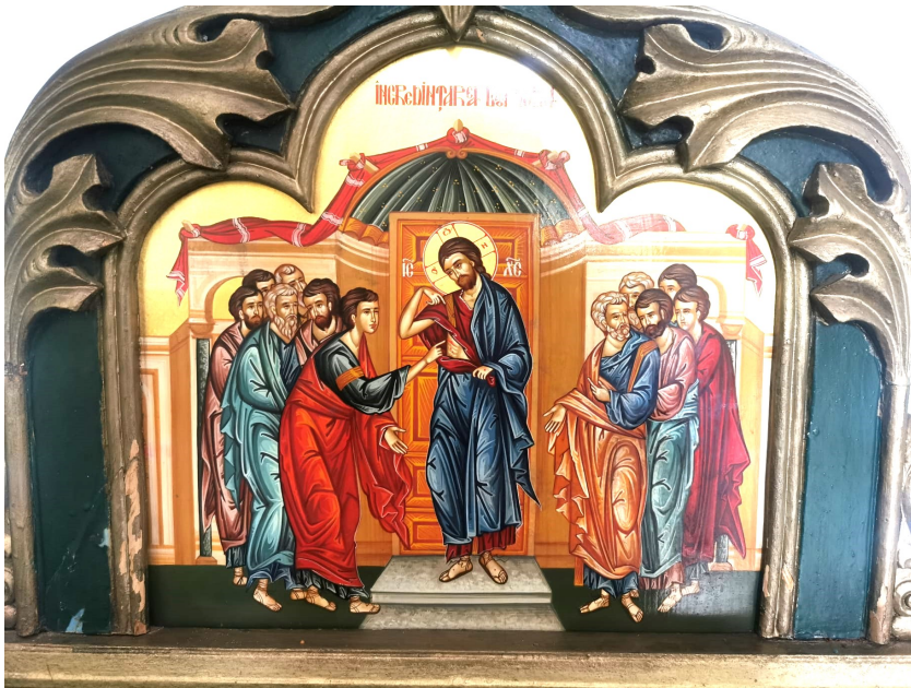
Icoană pe iconostasul mic din pridvorul bisericii noastre