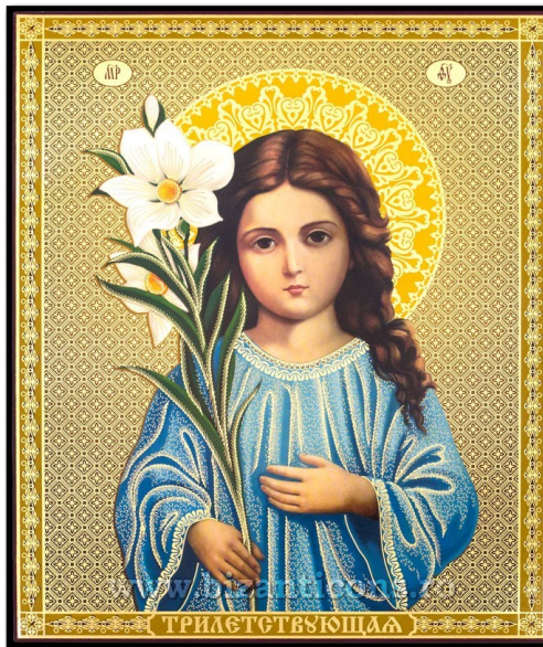
Maica Domnului Copil cu crin

Astăzi, 8 septembrie: Nașterea Maicii Domnului