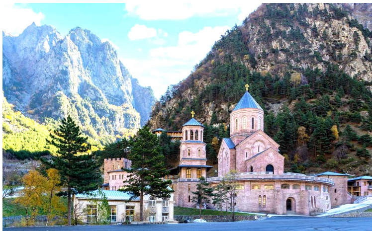
Complexul mănăstiresc Dariali

Ghida noastră, Mariami, ne-a comunicat că vom ajunge târziu la destinația finală, așa că ne-am oprit pentru a mânca ceva la un restaurant situat pe malul lacului Aragvi. Restaurantul se afla pe o platformă suspendată deasupra râului, într-o zonă foarte pitorească. Apoi, am purces mai departe la drum, poposind la Complexul monahal Dariali, închinat sfinților Arhangheli Mihail și Gavriil. Complexul este de dată recentă, început în 2005, construcția fiind terminată în 2011. Poziția a fost aleasă de actualul patriarh al Georgiei, Ilia al II-lea, fiind la o altitudine de 1300 m, aproape de vechiul drum al mătășii, pe actualul drum spre