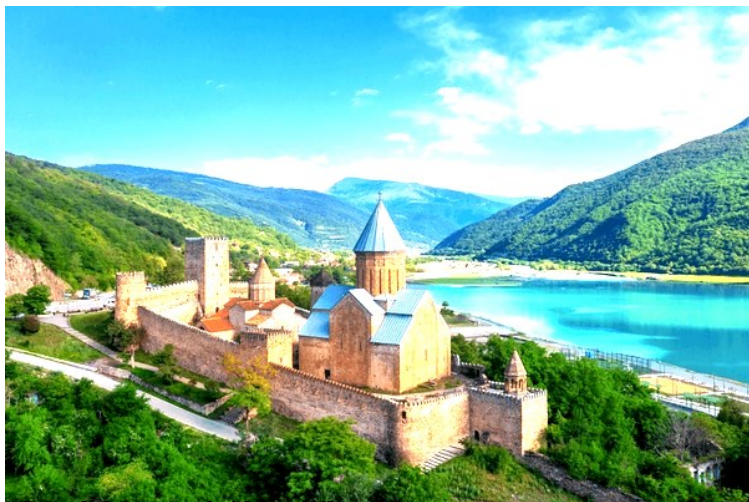
Castelul Ananuri și bisericile sale

Se spune că într-una dintre lupte a fost capturată de inamici o fecioară pe numele ei Ana din Nuri, care a fost torturată pentru a dezvălui locația tunelului. Aceasta a refuzat, alegând să moară în chinuri, decât să-și trădeze semenii. Astfel castelul îi poartă numele. O altă istorie relativ