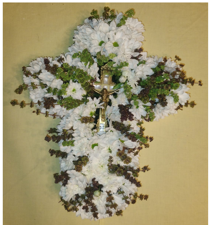
Sfânta Cruce împodobită la biserica noastră - vă mulțumim celor care ați arătat și de data aceasta dragoste față de Biserică.

Și, de vreme ce este așa, înmulțește-mi, Doamne, ostenețile, ispitele, durerile, dar să-mi înmulțești și să-mi prisosești și răbdarea și puterea, ca să pot răbda toate câte mi s-ar întâmpla. Pentru că recunosc că sunt neputincios, de nu mă vei întări, orb, de nu mă vei lumina, legat, de nu mă vei dezlega, fricos, de nu mă vei face îndrăzneț, rău, de nu mă vei preface în bun, pierdut, de nu mă vei ierta, rob, de nu mă vei răscumpăra, cu bogata și dumnezeiasca Ta putere și cu darul Sfintei Tale Cruci, căreia ne închinăm și o mărim, acum și pururea și în vecii vecilor. Amin.