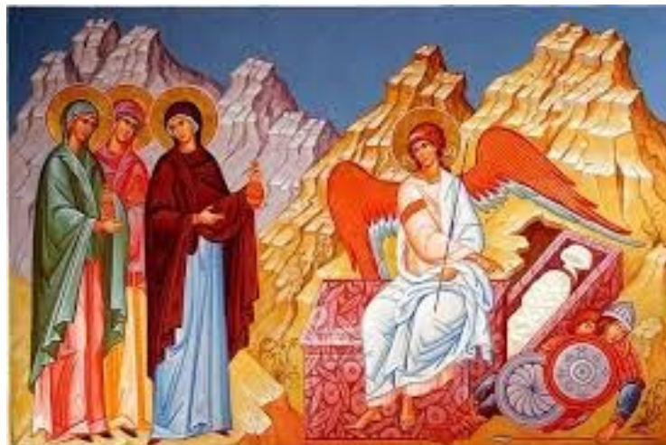
Femeile mironosițe primind de la înger vestea Învierii Domnului

În vremea aceea a venit Iosif cel din Arimateea, sfetnic ales, care aștepta și el Împărăția lui Dumnezeu, și, îndrăznind, a intrat la Pilat și a cerut trupul lui Iisus. Iar Pilat s-a mirat că Iisus a murit așa curând și, chemând pe sutaș, l-a întrebat dacă a murit de mult. Deci, aflând de la sutaș, a dăruit lui Iosif trupul. Atunci Iosif, cumpărând giulgiu și coborându-L de pe cruce, L-a înfășurat în giulgiu și L-a pus într-un mormânt care era săpat în stâncă și a prăvălit o piatră la ușa mormântului. Iar Maria Magdalena și Maria, mama lui Iosif, priveau unde L-au pus. Și, după ce a trecut ziua sâmbetei, Maria Magdalena, Maria, mama lui Iacov, și Salomeea au cumpărat miresme, ca să vină să-L ungă. Și dis-de-dimineață, în ziua cea dintâi a săptămânii, pe când răsărea soarele, au venit la mormânt; și ziceau între ele: Cine ne va prăvăli nouă piatra de la ușa mormântului? Dar, ridicându-și ochii, au văzut că piatra fusese răsturnată; căci era foarte mare. Și, intrând în mormânt, au văzut un tânăr șezând în partea dreaptă, îmbrăcat în veșmânt alb, și s-au spăimântat. Iar el le-a zis: Nu vă înpăimântați! Căutați pe Iisus Nazarineanul, Cel răstignit? A înviat! Nu este aici. Iată locul unde L-au pus. Dar mergeți și spuneți ucenicilor Lui și lui Petru că va merge în Galileea mai înainte de voi; acolo Îl veți vedea, după cum v-a spus vouă. Și, ieșind, au fugit de la mormânt, căci erau cuprinse de frică și de uimire, și nimănui nimic n-au spus, căci se temeau.